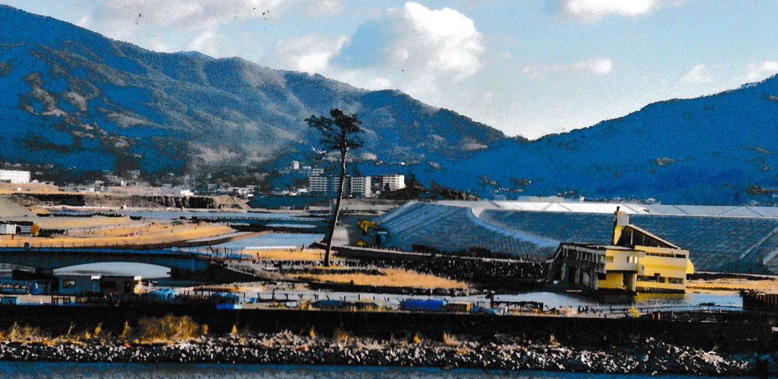
陸前高田市 奇跡の一本松(2018.1.7撮影)